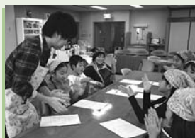
▲第1回環境フェスティバルの様子