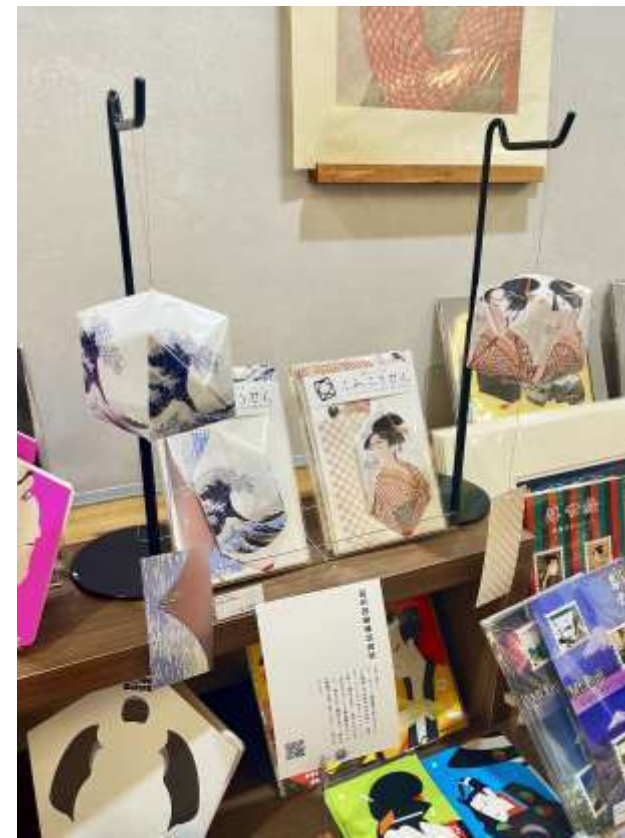
台東区大河ドラマ館 たいとう江戸もの市様