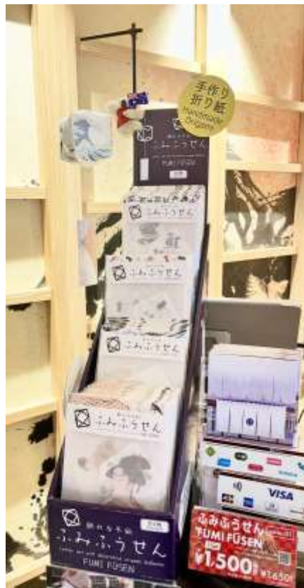
プロスタイル旅館東京浅草様 旅館澤の屋様