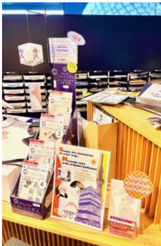
浅草文化観光センター様