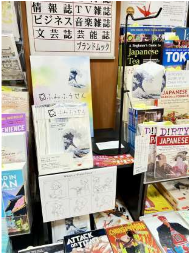
三省堂書店 東京ソラマチ店様

◆東京ソラマチと上野エリア・鎌倉エリアに登場！どちらも訪日外国人が多いエリアです