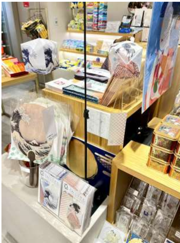
トーキョーみつグランスタ羽田 空港第1ターミナル店様