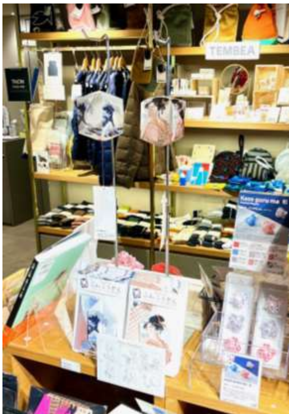
トーキョーみつ グランスタ東京店様

◆東京駅や羽田空港第1ターミナル、「べらぼう」人気沸騰中の台東区大河ドラマ館にも