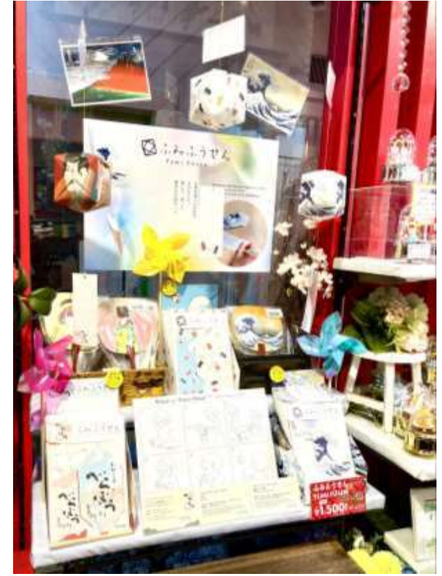
鎌倉び〜どろ・くりり様