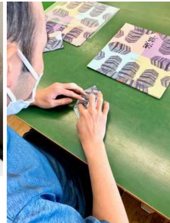
特定非営利活動法人 ブルーメ様