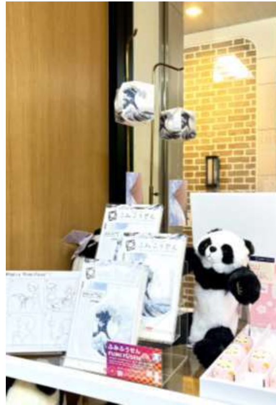
三省堂書店 アトレ上野店様