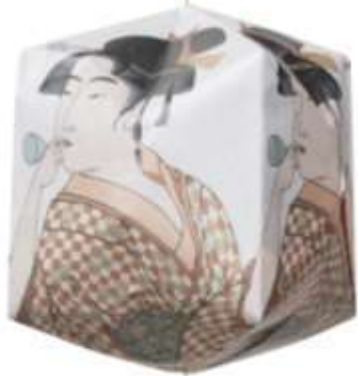
ビードロを吹く女