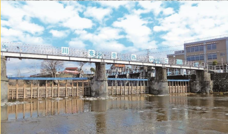
表紙:羽村取水堰の昔と今

明治以降の公文書や私文書などをもとに羽村市の歩みをたどります。貴重な資料の中から 447点を厳選し、章や節の解説とともに紹介します。新たに確認された「皇国地誌」草稿も初掲載です。