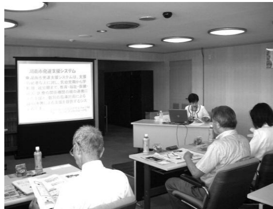
▲湖南市の発達支援システムの説明を受ける