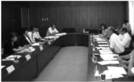
▲私立保育園協議会との懇談会の様子

それぞれの懇談会のなかで交わされた意見や要望等を踏まえ、10月25日に、羽村市子ども家庭部の担当部長と担当課職員との意見交換会を行い、それぞれの懇談会で出された内容や、保育園と幼稚園の連携等について意見交換を行いました。