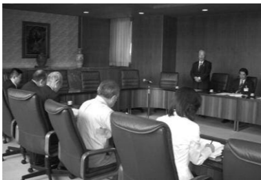
▲栗東市の子育て支援施策を伺う

JR琵琶湖線栗東駅の開設に伴い京阪神への通勤圏となった栗東市は、企業誘致や大規模な住宅整備が進み、若い子育て世代が増えています。年少人口比率が19%と高く、高齢化率は15.03%と県内でも低く、生産年齢比率が高い市であることが特徴でもあります。