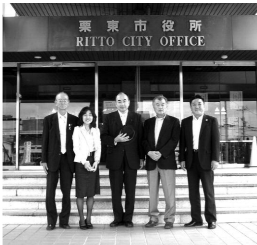
▲栗東市役所の前で