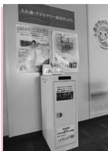
▲市役所1階ロビーの回収ボックス