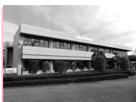
▲スポーツセンター