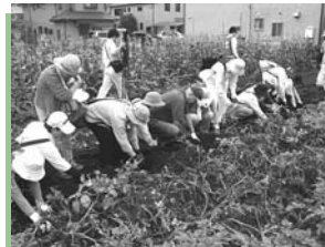
▲農ウオークの様子