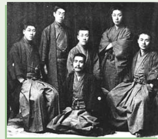
▲中里介山(下段中央)