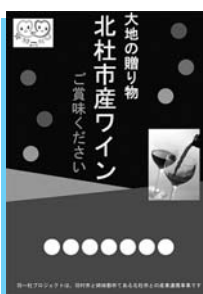
▲羽〜杜ワインポスター

※北杜市産ワイン取扱い飲食店について詳しくは、羽村市商工会ウェブページをご覧ください。 ※北杜市産ワインは、市内酒店（北浦酒店・高橋酒店）で購入することもできます。 問合せ 羽村市商工会 ☎ 5555-6211 / 産業課 経済対策係 ☎ 657