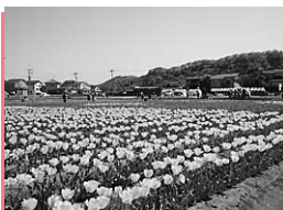
▲根がらみ前水田のチューリップ