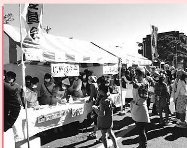
▲▲ 昨年の子どもフェスティバルの様子

当日は、青少年による模擬店やアトラクションのほか、ゆとりぎ全館で行う子ども向けイベントなどいろいろな催しが盛りだくさんです。ぜひ、お越しください。