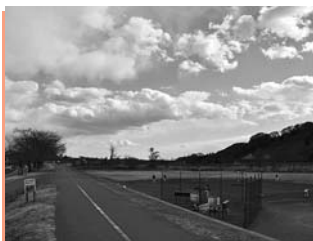
▲桜つつみ公園付近の風景

※申込用紙はスイングセンターで配布します。 ※はがきの場合は、「住所・氏名・年齢・連絡先」を記入し郵送してください。