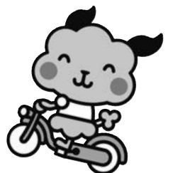
▲ マスコットキャラクター「ちよこる」

問合せ 制度・加入について：防災安全課交通・防犯係 216 / 会費の助成について：障害福祉課障害福祉係 173・高齢福祉介護課高齢福祉係 177