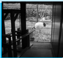
▲ツルさんの童話ランド ▲桜のトンネル

動物公園では約 160 本の桜が見ごろをおかえます。「はむら花と水のまつり 2014」に協賛して、4 月 6 日(日)は入園料を無料とします。