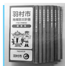
▲羽村市地域防災計画（概要版）

配布した概要版には、防災に関するコンパクトガイドを合わせて掲載しました。ぜひ活用していただき、普段から「自助」の備えの強化を図っていただきますよう、お願いいたします。