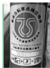
▲ TS マーク

TSマーク取扱店で自転車を購入したときや、点検・整備を受け点検・整備料を払うと、TSマークが貼られます。(有効期限1年)