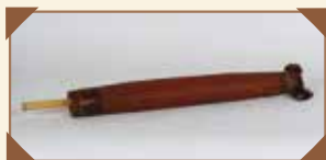
▲バンガサ 閉じた状態