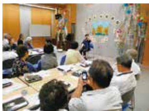
▲ボランティアによる演奏などを行う予定です。

現在、一部の老人クラブで行っている保育園との交流をさらに促進するため、今年度は玉水保育園とおおぞら保育園の年長組の園児も種目に参加し