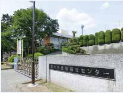
▲産業福祉センター

市内事業所およびその従業員が利用できる施設です。市内事業所が、自らの経営改善などを目的とした研修・会議などの場として使用する場合は、使用料を免除します。ぜひ、利用してください。