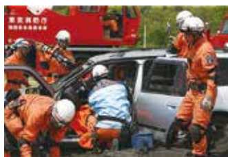
▲土砂災害救出訓練の様子