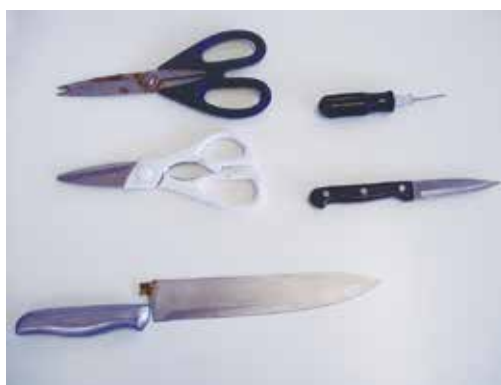
▲混入していた包丁・ナイフ・はさみ・ドライバー