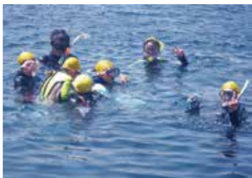
▲▶ 昨年の大島・子ども体験塾の様子

所定の申込用紙に必要事項・子ども体験塾に参加する動機を記入し、直接児童青少年課児童青少年係(☎)264へ ※申込用紙は、各学校・市役所2階児童青少年課で配布するほか、市公式サイトからダウンロードすることができます。