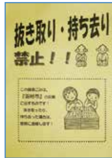
▲抜き取り・持ち去り 禁止の貼り紙

また、市公式サイトから貼り紙のデータをダウンロード して使うこともできます。 ●表示をしても抜き取る車を見かけた場合は、車種やナン バープレートの内容を記録し、すぐに警察に通報する 羽村市生活環境課生活環境係へ連絡してください。 問合せ 生活環境課生活環境係 205