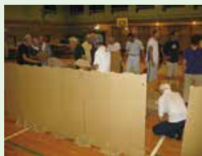
▲昨年の訓練の様子 学校の体育館に間仕切りをつくっているところ

家族や地域の人と一緒に総合防災訓練に参加して、普段からどんなことに気を付けなくてはならないのか、災害が起きたらどうしたらいいのかを学びましょう。