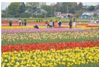
▲この秋植え付けたチューリップが来春咲き誇ります