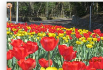
美原のチューリップ畑

そんな気持ちを、住む人すべてに抱いていただくために、 美原町内会 は日々、楽しく活動を行っています。