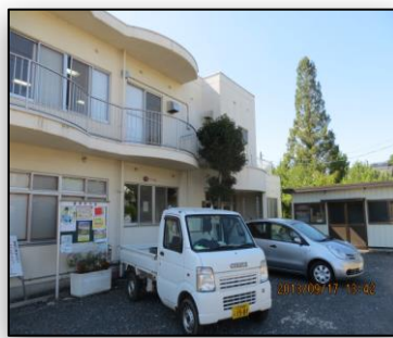
美原会館を大いに活用しましょう！