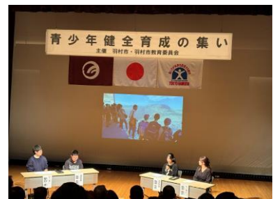
■大島・子ども体験塾活動報告

なお、「ゆとろぎ」前の道路などでは、子どもフェスティバルが行われ、子どもたち による模擬店、地区委員会の活動展示などが行われました。