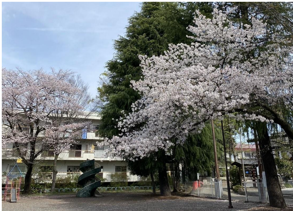
■ 神明児童公園の桜（昨年）