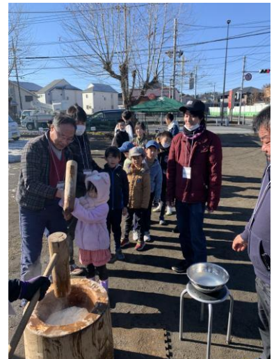
昨年の餅つき大会

内 容：餅、赤飯、おつまみ、漬物、ずりだしうどん、飲物(アルコール類、ソフトドリンク)