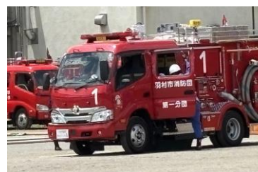
■ポンプ操法審査会