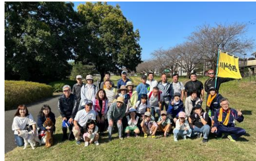
昨年の「歩け歩け大会」

一日10分3回」を推奨しています。「歩け歩け大会」に参加して、歩くことを習慣化する機会にしてみませんか。子どもから高齢者まで大勢の参加をお待ちしています。