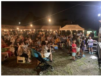
昨年の納涼の夕べ

4 月 2 6 日に開催した第 1 回役員会で、令和 7 年度川崎西町内会の行事日程等が下表のように決まりました。今後、詳細については、回覧板を通じてお知らせしてまいります。皆様の参加とご協力をお願いします。