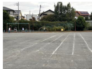
■整備された児童遊園

町内会会員の皆様、秋も深まり、寒さも一段と厳しくなってまいります。どうぞ、ご自愛ください。