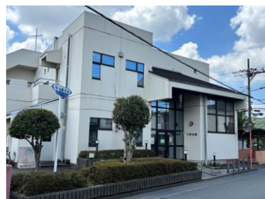
■地域集会施設川崎会館

7月8日開催の町内会連合会会議において、市から「将来にわたり厳しい財政状況が予測されることから、公共施設を見直し・統廃合する構想がある」との説明があり、現在、市内に23カ所ある地域集会施設(会館)を10カ所に縮小していくとの案が示されました。川崎地区においても、川崎東・西、上水通り地区に1カ所とする計画となっています。地域集会施設の統廃合は、令和13年度から17年度までを当面の実施時期とする予定であるとのことでした。既存の会館が廃止となる町内会・自治会もあることから、大きな影響があります。今後、町内会連合会として検討、対応を図っていくこととなりました。