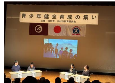
■大島・子ども体験塾活動報告

なお、「ゆとろぎ」前の道路などでは、子どもフェスティバルが行われ、子どもたち による模擬店、地区委員会の活動展示などが行われました。