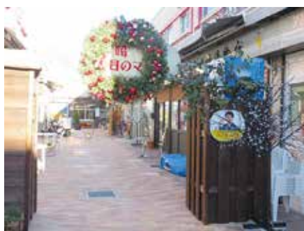
▲アンテナショップ・コミュニティスペース「YORIMICHI」