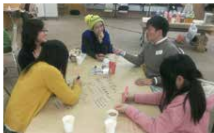
▲未来カフェの様子

まるでカフェにいるかのように誰もが楽しく本音を語り、新しい気づきを得る効果の高い話し合いの手法