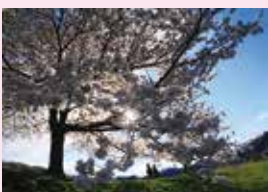
▲「はむら花と水のまつり2014」写真コンクール最優秀賞作品