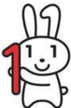
▲マイナンバー広報用ロゴマーク「マイナちゃん」

マイナンバーは、番号が漏えいし、不正に使われるおそれがある場合を除き、一生変更されません。