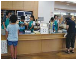
▲一日司書体験の様子

申込み・問合せ 7月4日(土)から(月曜日を除く)の午前10時〜午後8時に、電話または直接図書館へ ☎ 554-2280