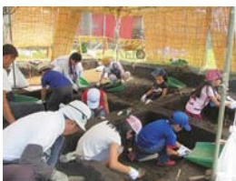
▲遺跡を発掘してみよう!

申込み・問合せ 7月3日(金)〜19日(日)(6日(月)・13日(月)を除く)の午前9時から午後5時までに、電話で郷土博物館へ ☎ 558-2561