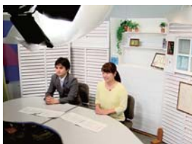
▲テレビはむらのスタジオに入ってみよう