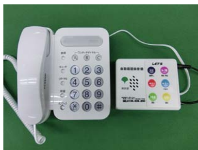
▲自動通話録音機(右)設置イメージ 電話回線と電話機の間設置します