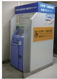
▲自動交付機のサービスは停止します

■ 羽村市公式サイト閲覧・羽村市メール配信サービスの配信：広報広聴課 広報係 ③37