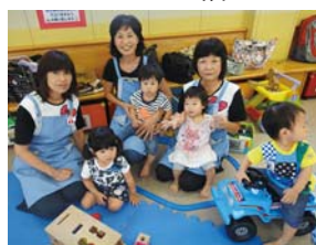
▲子育てボランティア「アップル」の活動の様子