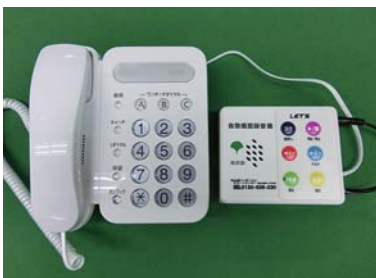
▲自動通話録音機(右)の設置イメージ