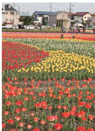
▲この秋植え付けたチューリップが来春咲き誇ります