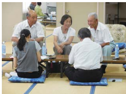
▲市内民俗調査(第1回予備調査)の様子

調査では、羽村で栄えた養蚕の話、子どもたちの遊びの話、昔の家の行事や食事の様子など、貴重な話をたくさん伺いました。