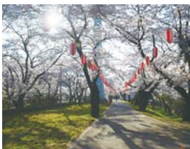
▲「はむら花と水のまつり2015」写真コンクール最優秀賞作品

■ A4判(210mm×297mm)または四つ切り(254mm×305mm)でプリントして提出