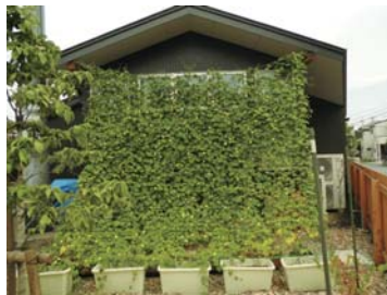
▲まつぼっくり保育園のグリーンカーテン