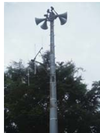
▲防災行政無線スピーカー