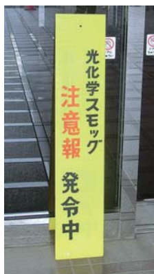
▲注意報発令時にお知らせします