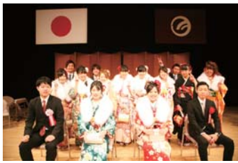
▲成人式を盛り上げましょう！ (平成28年成人式スタッフ)