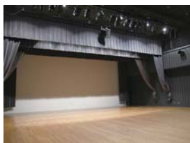
▲ホールの音響・照明の操作を体験！