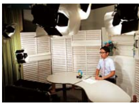
▲テレビはむらのスタジオに入ってみよう