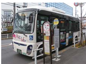
▲コミュニティバス「はむらん」

随時募集中！ はむらんに車内広告を出しませんか コミュニティバス「はむらん」は、毎日市内を走り、年間18万人以上の方が利用しています。地元の足として活躍する「はむらん」に広告を掲載してみませんか。「はむらん」の全4コースの中からコースを選んで掲載することができます。 広告掲載期間 1か月単位 広告料 (1か月) 1コース1枠3000円 規格 B3判(縦346mm×横515mm)以内 ※窓枠・中吊りいずれも同じ料金です。 申込み 西東京バス(株)青梅営業所へ ※申込みは随時受け付けています。 問合せ 広告について：西東京バス(株)青梅営業所 ☎0428-3210621 / はむらんについて：都市計画課住宅・交通係 ☎276