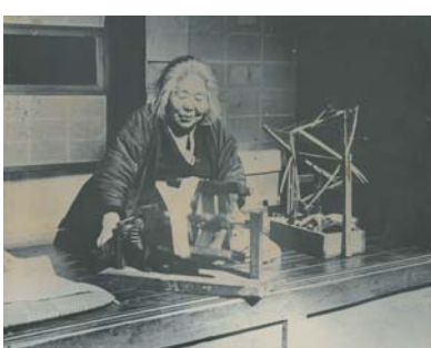
▲繰糸道具を使った糸ひき (昭和 20 ~ 30 年代)