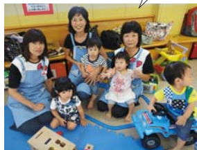
▲「アップル」の活動の様子