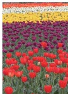
▲根がらみ前水田のチューリップ