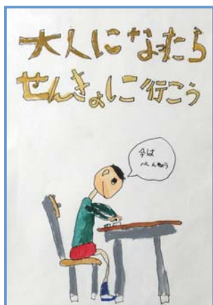
▲千葉幹哲さんの作品