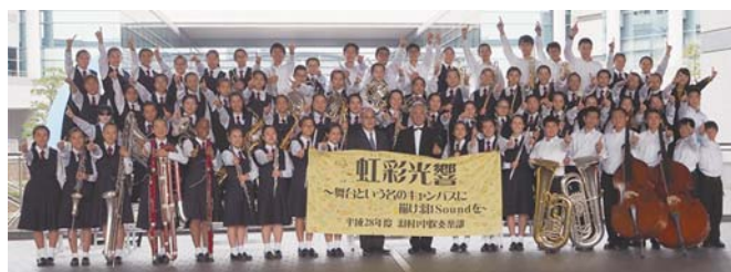
▲金賞受賞を喜ぶ吹奏楽部の皆さん