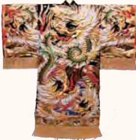
▲神楽衣装

日時 1月7日(土)〜15日(日)の午前10時〜午後5時 会場 展示室 入場料 無料 協力 有福神楽保持者会・島根県立古代出雲歴史博物館