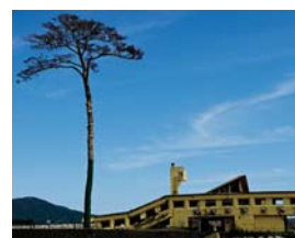
▲奇跡の一本松

日時 3月8日(水)～14日(火) (3月13日(月)を除く)の午前10時～午後5時 会場 ゆとろろ ぎ展示室 入場料 無料 ※直接会場へお越しください。