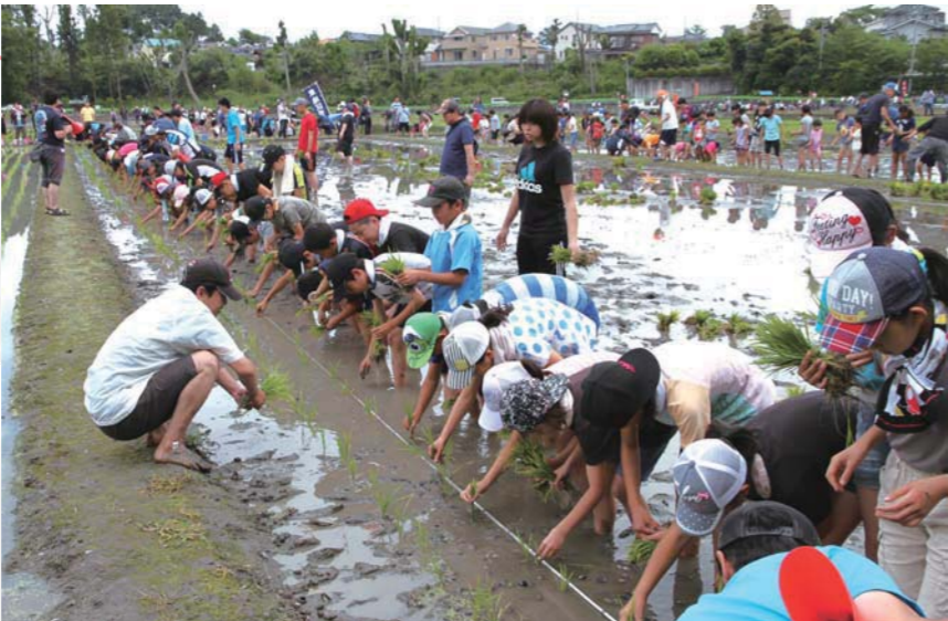
①田んぼ体験事業で6月に行われる「田植え」。泥に触るのが初めての子もいて最初は大騒ぎ ②11月に行われる「子どもフェスティバル」では、出店で働く小学校高学年の子どもたちの元気な売り声が響く ③50年以上の歴史がある夏の少年少女球技大会。昨年の優勝チームが選手宣誓 (どの写真も平成28年)

● 葛尾 子どもを取り巻く組織であるPTA、町内会、青少対はそれぞれ忙しいですが、お互いに協力し合って、羽村の大人みんなで、子どもたちの健やかな成長と笑顔を守っていききたいです。