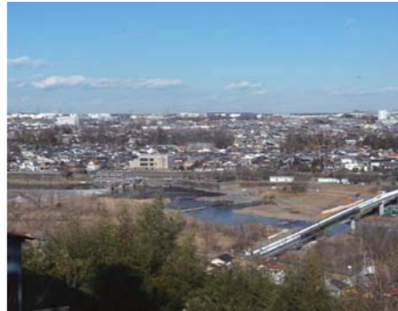
※内容は要約しています。詳細はインターネット録画中継(12月9日・21日分)または会議録でご覧いただけます。 ▼インターネットで会議録をご覧になる場合は「羽村市議会」→「会議録の検索と閲覧」 → 「平成28年第6回定例会」

■11月に開催された2回の臨時会では、選挙管理委員の選挙1件と、訴えの提起など2件の審議を行いました。