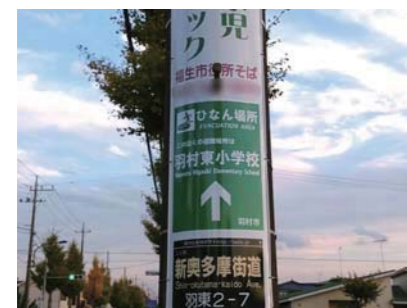
羽東に設置されている電柱広告誘導標識

市長 市内には、避難所太陽光誘導標識灯が4か所、電柱広告誘導標識が2か所設置されている。避難者誘導に効果的であり、今後も設置に取り組んでいく。 地域包括ケアシステムの体制と方向性について 質問 ボランティア充実への取組みと、人材確保に向けた支援については。 市長 養成研修や、社協への支援などで担い手の充実と、雇用対策事業の推進と