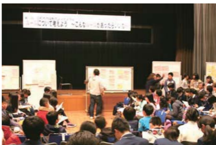
市P連や青少年育成委員会、副校長会、杏林大学とともに実行委員会を結成して毎年開催する地域教育シンポジウム(平成27年度の様子)

松林地区では、夏休みのラジオ体操会に延べ350人が参加しました。他の地区の事業を参考に、今年初めて行った飯盒炊き・カレー作り体験会には、約90人が参加しました。活動を知ってもらうため、会報の第1号も発行しました。