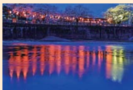
▲「はむら花と水のまつり2016」写真コンクール最優秀賞作品