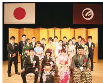
▲成人式を盛り上げましょう! (平成29年成人式スタッフ)