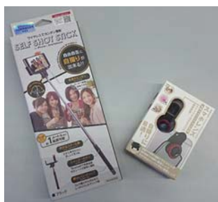
▲スマートフォンレンズか自撮り棒をプレゼントします(1組1個)