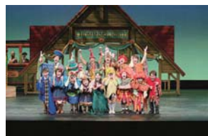
▲写真はこれまでの公演より