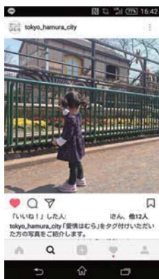
▲インスタグラムのイメージ