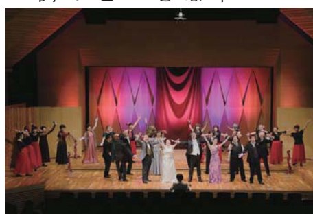
▲昨年の「八ヶ岳音楽祭」

内 容 時は19世紀半ば、パリの華やかな社交界とその郊外を舞台に「乾杯の歌」など数々の名曲とともに描かれる悲劇の愛の物語。日本語詞訳で上演します。