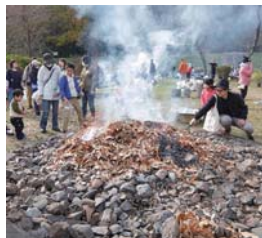
▲昨冬の落ち葉焚きの様子。今年は何を焼こうかな?