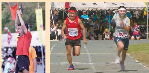
▲猫ひろし選手と辻沙絵選手