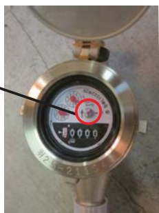
▶漏水していないか確認しましょう(水道を使っていないのに回っていたら要注意)