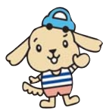
▲マスコットキャラクター「ちよこ助」