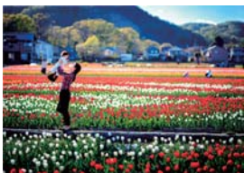
▲「はむら花と水のまつり2017」写真コンクール最優秀賞作品

までに申込用紙に必要事項を記入の上、作品の裏面に貼り付けて郵送または直接羽村市観光協会へ ☎5555-9667 〒205-0014 羽村市羽東1-13-15(直接の場合は土・日曜日、祝日を除く午前9時～午後5時) ※詳しくは、羽村市観光協会ウェブサイトまたは羽村市観光案内所で配布する写真コンクール募集要項をご覧ください。