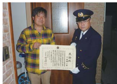
▲消防総監感謝状を贈呈