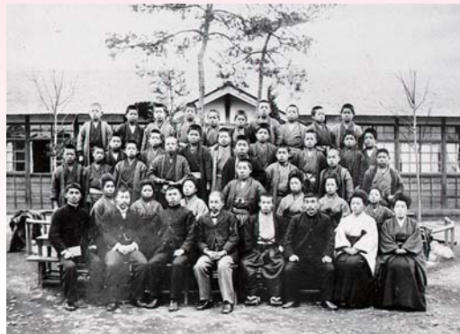
▲西多摩小学校諏訪ノ森校舎 明治後期（現在の玉川神社あたり）