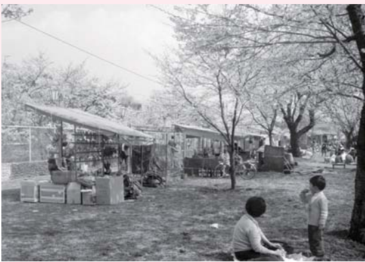
▲さくらまつり 昭和50年4月