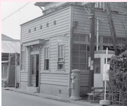
▲羽村郵便局 昭和41年ごろ（現在の羽村南郵便局）