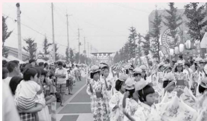
▲第1回はむら夏まつり 昭和51年8月