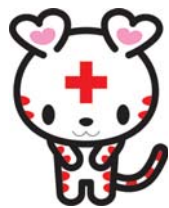
▲ 日本赤十字社 〒100-8305 東京都千代田区千代田1-1-1 〒100-8305 東京都千代田区千代田1-1-1