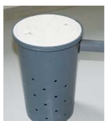
▲このような形をしています

雨水を地面に浸透させ地下水の環境を整えるための施設です。設置すると助成が受けられず(詳しくは8ページをご覧ください)。