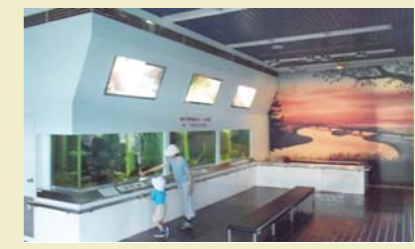
▲多摩川上流水再生センターでは、ミニ水族館で多摩川に生息する魚などを展示している

使用した後の水道水は、下水道管を通して、昭島市にある「多摩川上流水再生センター」や八王子市にある「八王子水再生センター」に送られます。水再生センターで下水処理を行い、処理した後の水は多摩川に放流するとともに、一部をろ過して同センター内の機械の洗浄・冷却やトイレ用水などに使用しています。